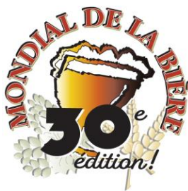
TABLE DES MATIÈRES BIÈRE ET AUTRES PRODUITS ALCOOLISÉS